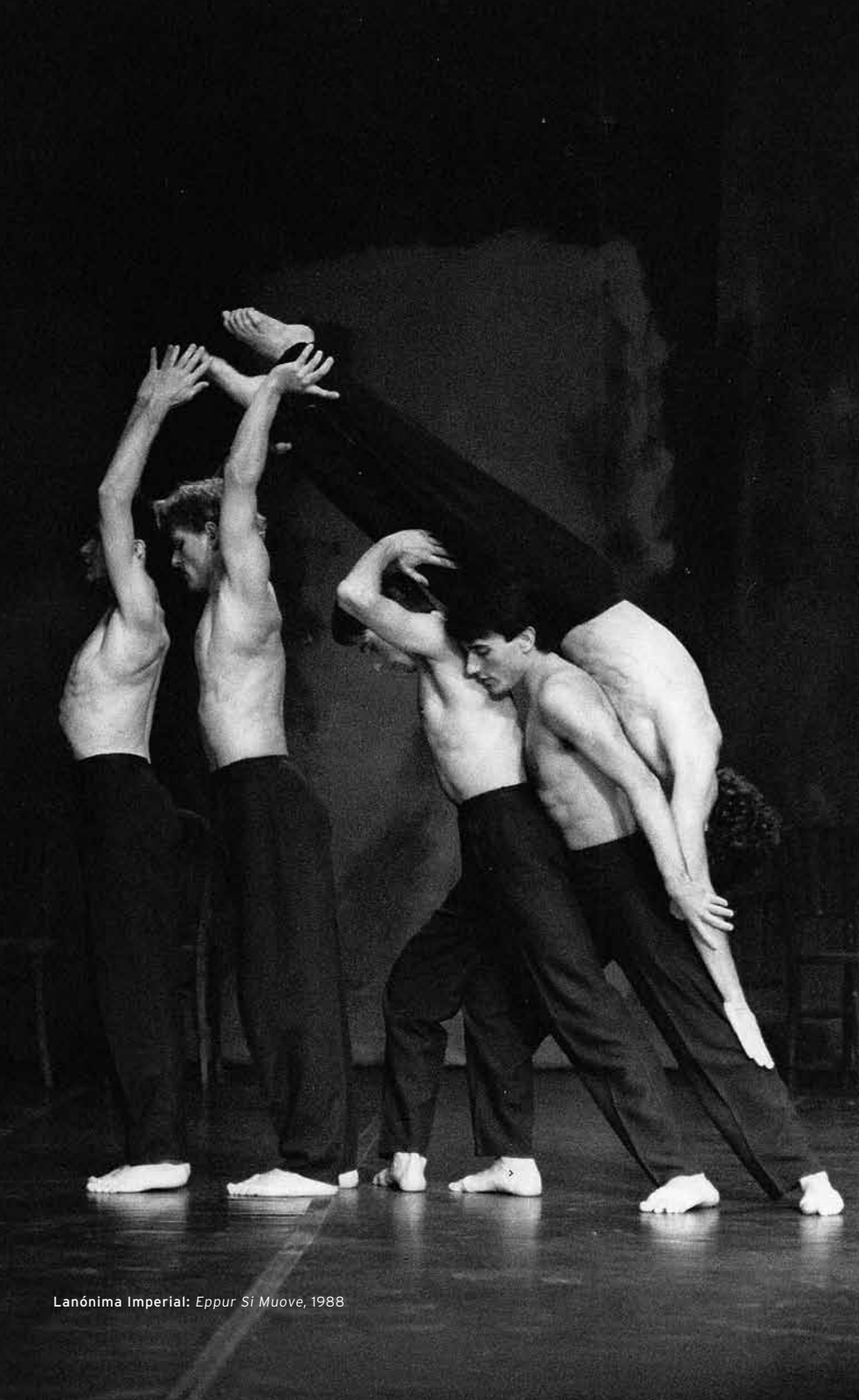
Lanónima Imperial: Eppur Sì Muove, 1988