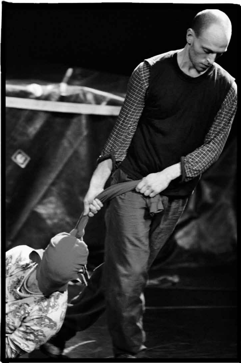
Les Ballets C de la B & Koen Augustijn: Bâche , 2005