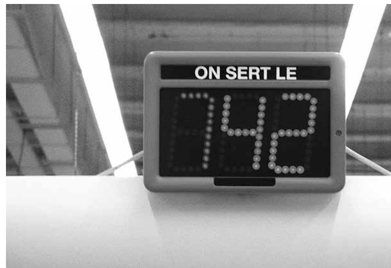
Compagnie Felix Ruckert: Secret Service , 2003