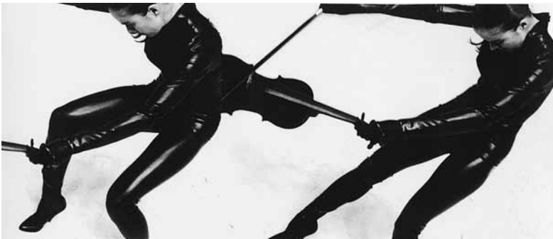
NEUER TANZ: Revolver , 2005