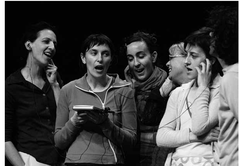
Jérôme Bel: The show must go on , 2008

©L.BERNAERTS, I.MÜLLER & DRIEST ONTWERPEN